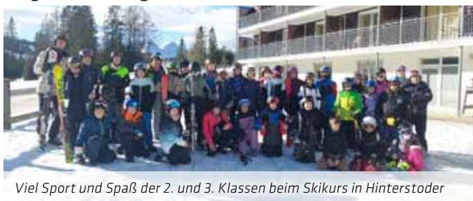
Viel Sport und Spaß der 2. und 3. Klassen beim Skikurs in Hinterstoder

Im Februar durften 32 SchülerInnen eine Woche lang ausprobieren, was für Wolfgang Ambros das „leiwaundste“ ist, was man sich nur vorstellen kann. Statt Deutsch, Englisch oder Mathematik stand der Skikurs am Stundenplan. Gemeinsam mit ihren vier Lehrkräften verbrachten sie eine Woche auf der Edtbauernalm in Hinterstoder. Aufgeteilt in vier Gruppen (Anfänger und Pistenfahrer) wurde das Schifahren erlernt oder perfektioniert. Natürlich kam das Gemeinschaftsgefühl und die gute Stimmung nicht zu kurz.