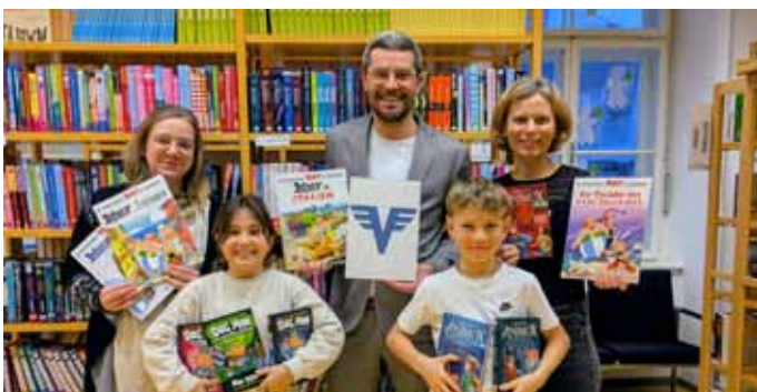
Die Volksbank Grein sponsert Comics