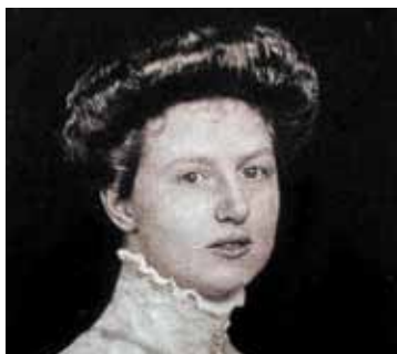
Herzogin Viktoria Adelheid

Die Viktoria-Adelheid-Schutzhütte am Brandstetterkogel blickt auf 100 Jahre Geschichte zurück. Seit einem Jahrhundert ist sie ein beliebter Treffpunkt für Wanderer, Naturfreunde und Familien aus der Region – ein Ort der Begegnung, der Bewegung und der Gemeinschaft.